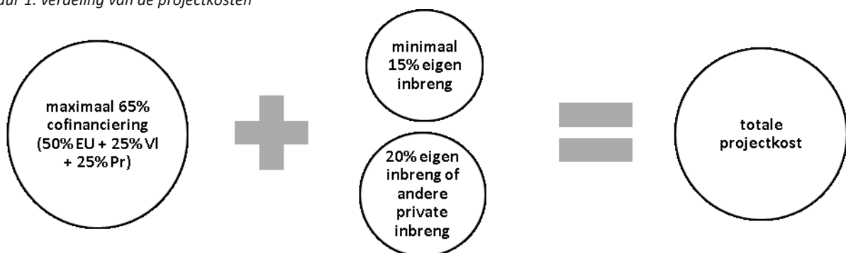
Figuur 1: verdeling van de projectkosten

De middelen van het plattelandsfonds daarentegen zijn trekkingsrechten en worden beschouwd als eigen gemeentelijke middelen. Daardoor kunnen ze wel gecombineerd worden met deze subsidie. Gegenerende inkomsten uit het project worden overigens niet beschouwd als eigen inbreng van de promotor.