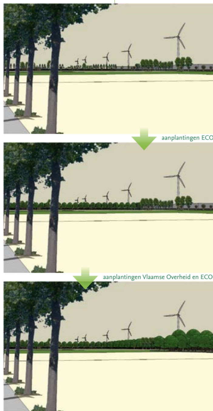
Zicht op koppingsgebied Rieme-Zuid