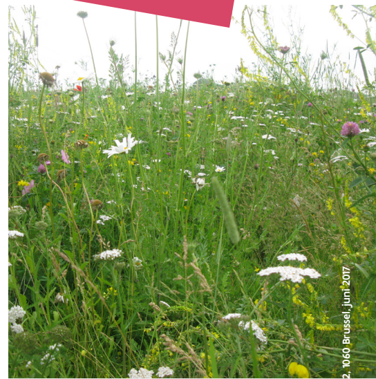
Meerjarige bloemenstrook ↑