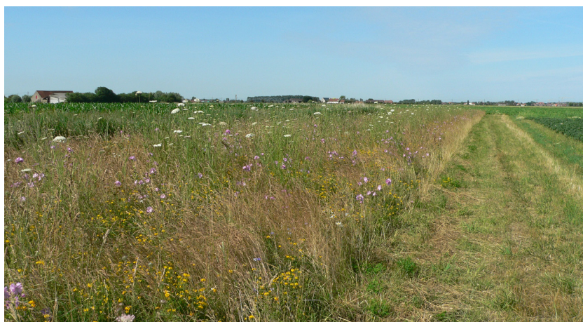
Gemengde grasstrook plus