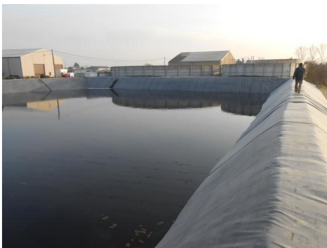
Fig. 2: Zicht op een lagune gevuld met effluent

Effluent heeft een lage stikstof- en fosfaathouding, maar de zouten (K, Cl, Na) zijn nog steeds aanwezig. Effluent, afkomstig uit de biologische verwerking van mest wordt beschouwd als een dierlijke meststof in het kader van de mestwetgeving.