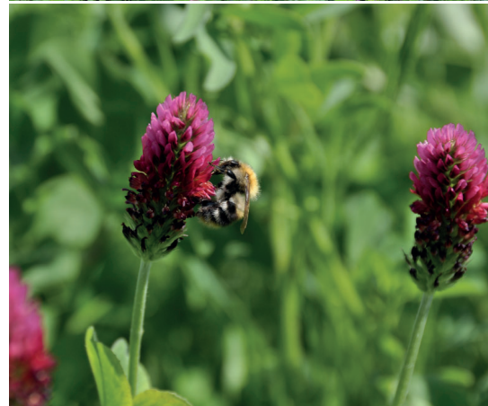
Klavermengsel Hommel op Inkarnaatklaver