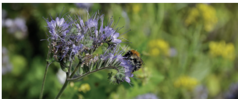
Hommel op phacelia