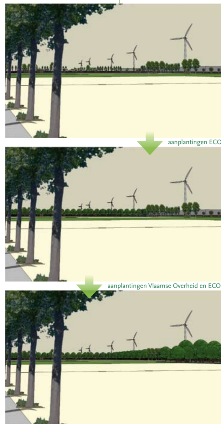
Zicht op koppingsgebied Rieme-Zuid