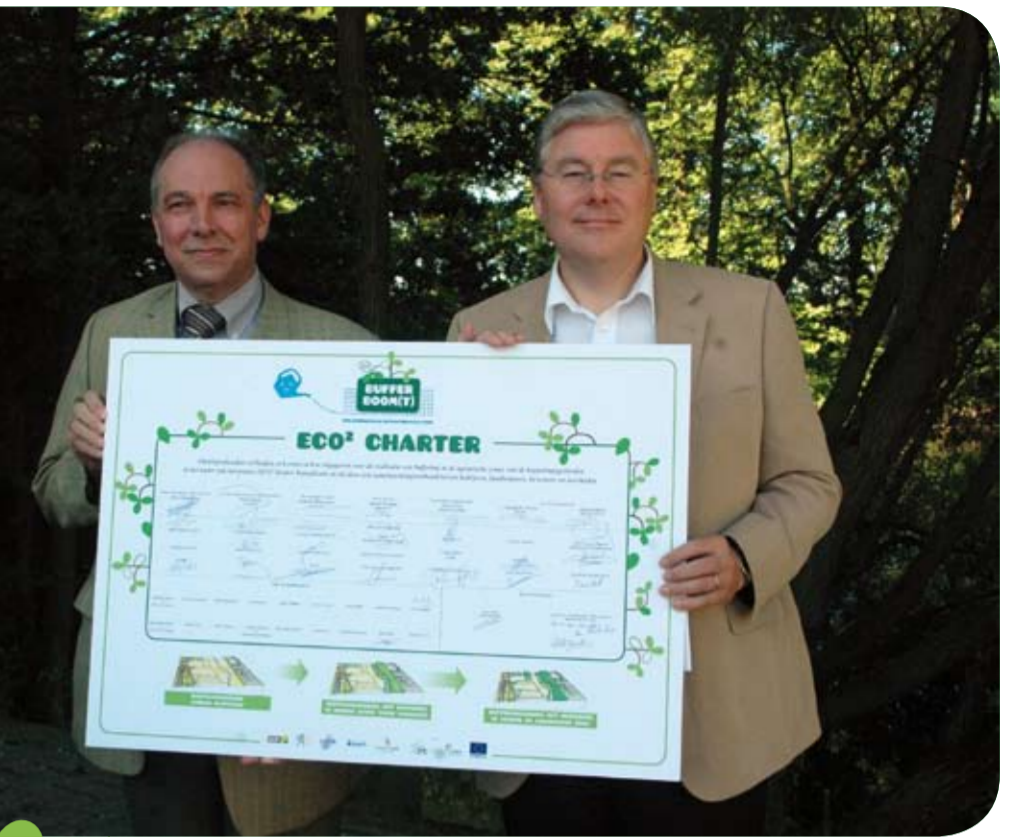
Gouden peters 'Stora Enso' en 'ArcelorMittal'

'ArcelorMittal investeert al jaar en dag in groenbuffers op onze eigen terreinen. Ook in dit project kiezen we voluit voor de zorg om het landschap. We doen dit niet alleen om de hinder die onze activiteiten kunnen veroorzaken, te milderen. We werken ook graag aan een aangename woon- en werkomgeving. Het bijzondere aan dit project? Er zijn geen verliezers. Iedereen wint! Landbouwers krijgen een correcte vergoeding – ze investeren toch grond, tijd en arbeid –, omwonenden en fietsers een kwaliteitsvolle leefomgeving en wij, bedrijven, een goede relatie met de buurt. Bovendien gebeurt alles op vrijwillige basis. Er is geen sprake van gedwongen onteigeningen, conflicterende belangen... Kortom: landbouwers, omwonenden en bedrijven staan samen op één lijn.'