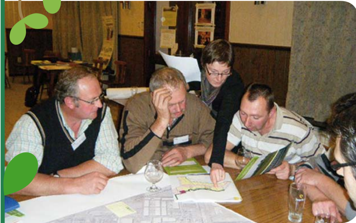
Landbouwers overleggen waar ze bomen kunnen planten

'Waarom we meestappen in dit project? Voor het uitzicht natuurlijk. Een mooier landschap, daar geniet iedereen van. En dat komt dan weer het imago van de landbouw ten goede. De vergoeding die we krijgen voor de aanleg van de buffers is zeker mooi meegenomen. Maar daar tegenover staat dat we blijven instaan voor het onderhoud. Op onze percelen gaat het vooral om knotwilgen. Die moeten geregeld worden gesnoeid. Tegelijk bieden ze beschutting aan het vee op onze weiden. Dat is natuurlijk ook een voordeel.'