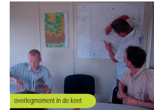
overlegmoment in de keel

Uiteindelijk volgen dan nog de kostenverdeling en het verlijden van de aanvullende akte, gepland in 2012. Ook bij de kostenverdeling hoort een openbaar onderzoek, met informatie over wie wat betaalt, in welke kosten de eigenaars bijdragen, hoe de bedragen berekend worden, enzovoort. De aanvullende akte regelt de financiële rechten en plichten.