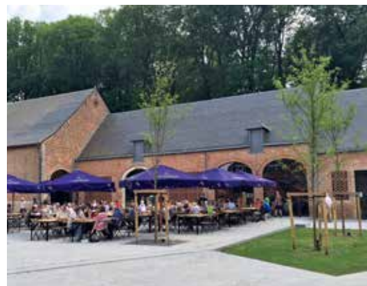
In het nieuwe belevingscentrum kun je abdijbier, brood en kaas proeven.

Ook de komende maanden en jaren wordt er nog gewerkt in de omgeving van de abdij. Vanaf de Luikerdreef komt er een doorkijk naar het majestueuze gebouw. Daarvoor zal de abdij, in het kader van haar bosbeheerwerken, een populierenbos kappen en op de akker ernaast een nieuw bos aanplanten. In een latere fase wordt ook het Mariapark naast de abdij opnieuw ingericht. Het sluitstuk van de werken wordt de herinrichting van de Abdijsstraat voor de ingang van het gebouw. Daar worden de slordig ogende parkeerplaatsen vervangen door een uitnodigend onthaalplein. De herinrichting van het gebied wordt mede mogelijk gemaakt door de VLM, de gemeenten, de toeristische diensten van de drie provincies, Boerenbond, Onroerend Erfgoed, Rurant, de regionale landschappen, de Merode Ondernemers vzw en diverse lokale verenigingen.