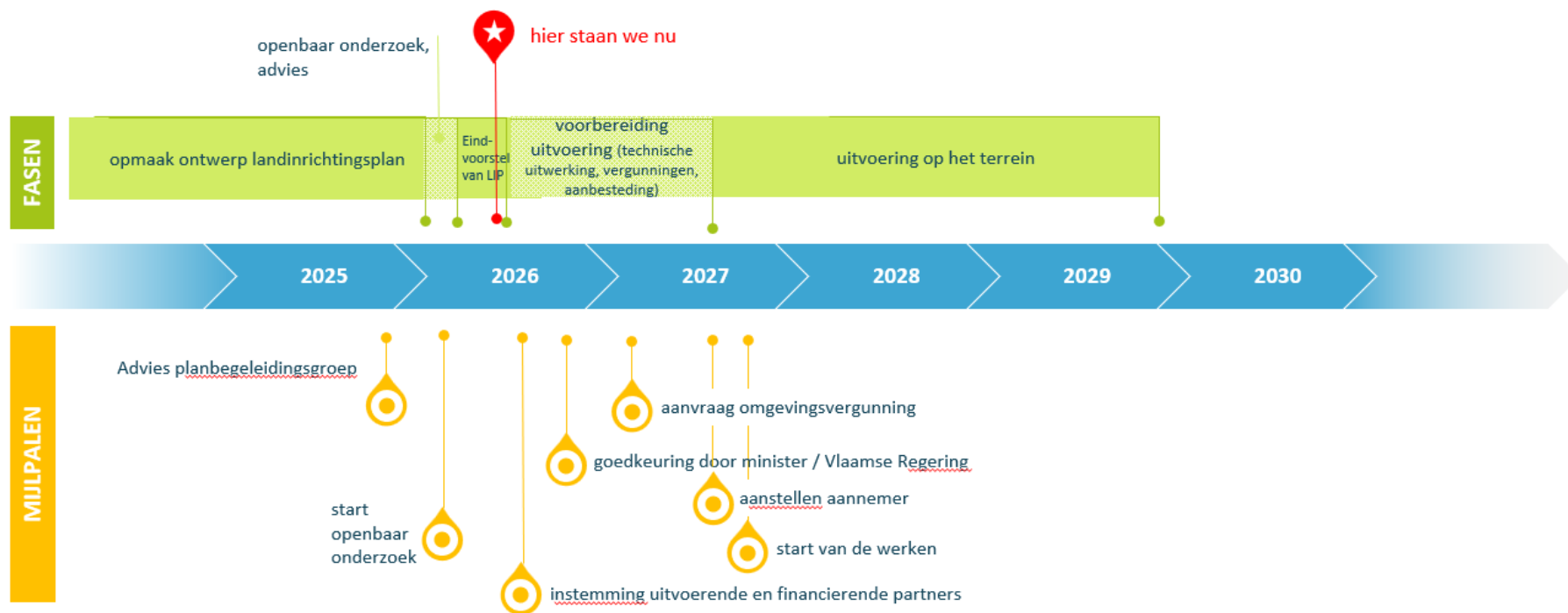
Figuur 1: indicatieve timing voor opmaak en uitvoering van het landinrichtingsplan Onthaal en beleving fase 2. Deze planning is onder voorbehoud en afhankelijk van de planning van externe instanties.