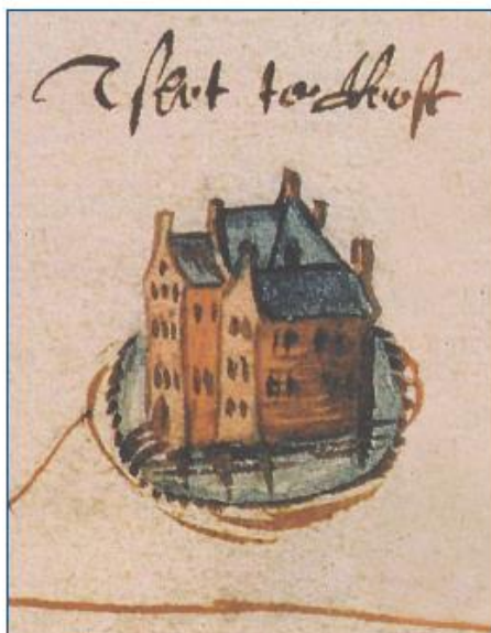
Geschetste voorstelling van het kasteel van Roost omstreeks 1505