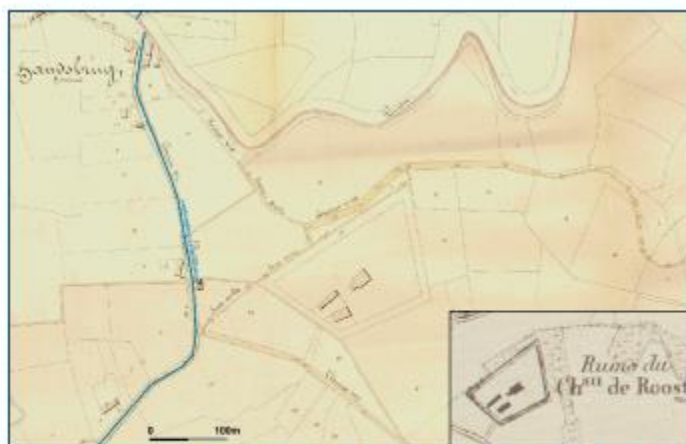
Het kasteel van Roost en omgeving omstreeks het begin van de 19de eeuw zoals afgebeeld op de Atlas van de Buurtwegen. Hoewel nog steeds gebouwen aanwezig waren, blijkt het kasteel volgens de gelijktijdige Vandermaelenkaart al grotendeels vervallen.

Eind 18de begin 19de eeuw werden de oorspronkelijke binnen- en buitenste slotgrachten gedempt en werd een nieuwe gracht gegraven rond het perceel. Door de hoge kosten en het vervallen van de heerlijke rechten had het kasteel nog weinig nut voor de kasteeleigenaren. Uit een algemeen verslag over de gemeente Haacht uit 1830 blijkt dat het kasteel in 1828 werd afgebroken ' ...er heeft tot in 't jaer 1828, wanneer men 't heeft afgebroken, een oud kasteel oft fort, genaamd het kasteel van Roost, digt aen de rivier de Dyele, gestaen '. Hoewel onbewoond, stonden de neerhofgebouwen nl. een woonhuis met stal en een schuur, nog overeind.. Uiteindelijk brandde het neerhof af in 1833. Het bouw materiaal van het kasteel werd hergebruikt en zou, vooral in kelders en onderbouw, nog te vinden zijn in de vooroorlogs huizen in de gemeente.. Een dikke houten balk uit het kasteel zou ook gebruikt zijn als spil voor de bouw van de oude Keerbergse molen.