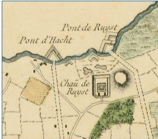
Uitsnede van de militaire kaart van Haacht en omstreken van ca. 1747. Ten noorden en noordwesten van het kasteel zijn langs de Dijle diverse versterkingen aangebracht.