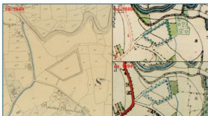
Omstreeks 1840 zijn geen gebouwen meer aanwezig volgens de kadasterkaart van Popp (bron: Agentschap voor Geografische Informatie Vlaanderen (AGIV)). Wel is nog een trapezoidaal grachtenstelsel herkenbaar. Deze situatie blijft doorheen de 19 de eeuw grotendeels ongewijzigd (bron: Institut Cartographique Militaire, 1880 en 1894)