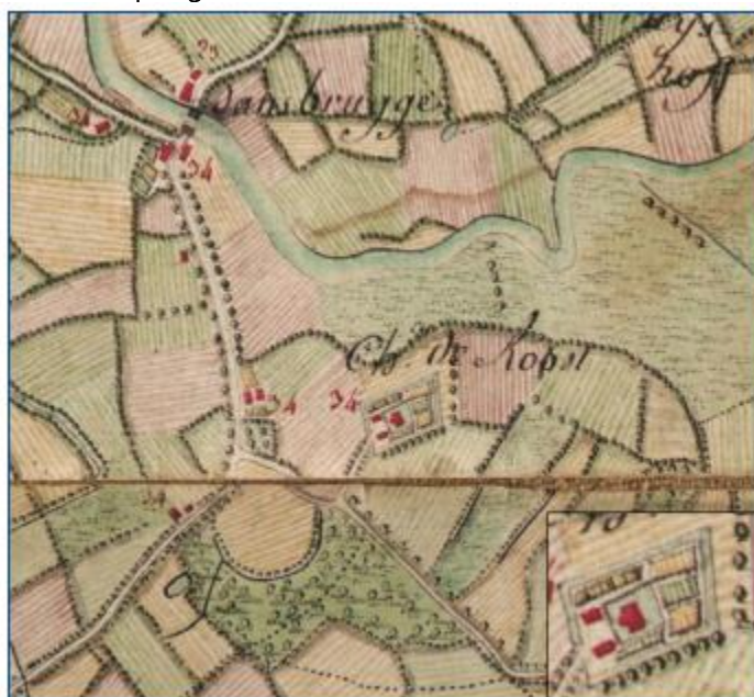
Uitsnede van de Ferrariskaart uit 1775, Blad Semps (Zemst) 92