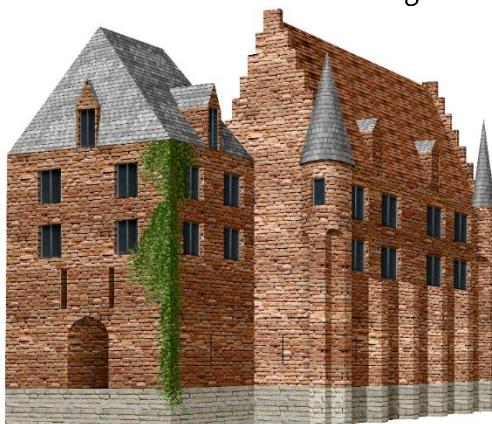
3D interpretatie gebaseerd op het opgegraven grondplan de 16de eeuwse schildering.

Een meier of drossaard handelde lopende zaken af voor de eigenaar en namen zijn intrek in wat er van het kasteel nog overbleef.