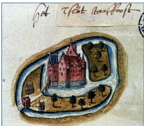
Weergave van het kasteel van Roost omstreeks 1505-1585