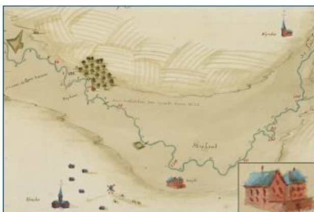
Uitsnede van de kaart die de loop van de Dijle tussen Mechelen en Werchter aangeeft. Deze militaire kaart wordt gedateerd in de tweede helft van de 17de eeuw