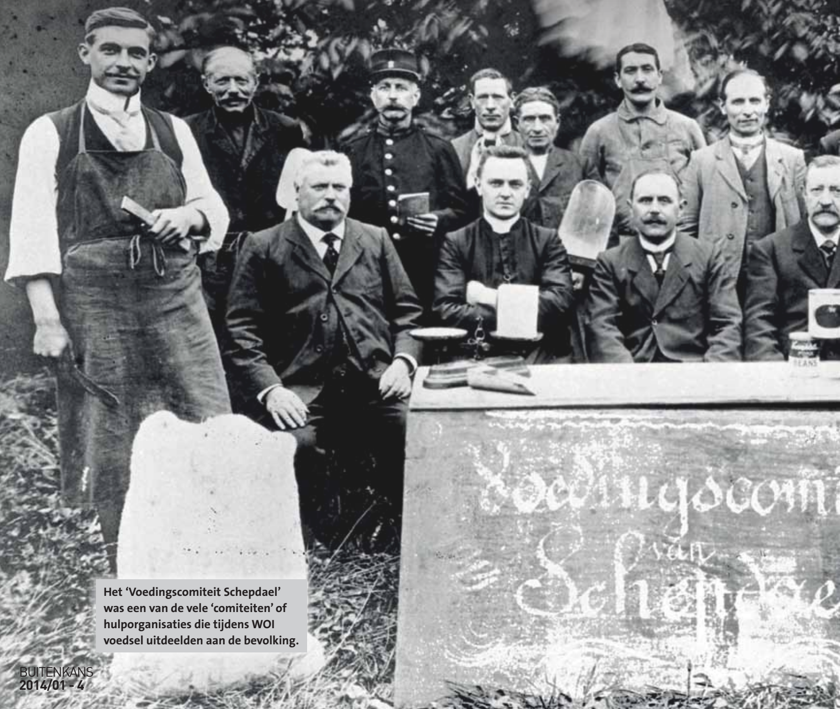
Het 'Voedingscomiteit Schepdael' was een van de vele 'comiteiten' of hulporganisaties die tijdens WO1 voedsel uitdeelden aan de bevolking.