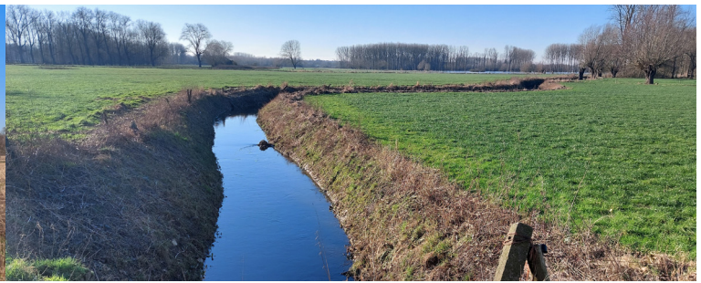
De Pinte ter hoogte van Doornhammeke