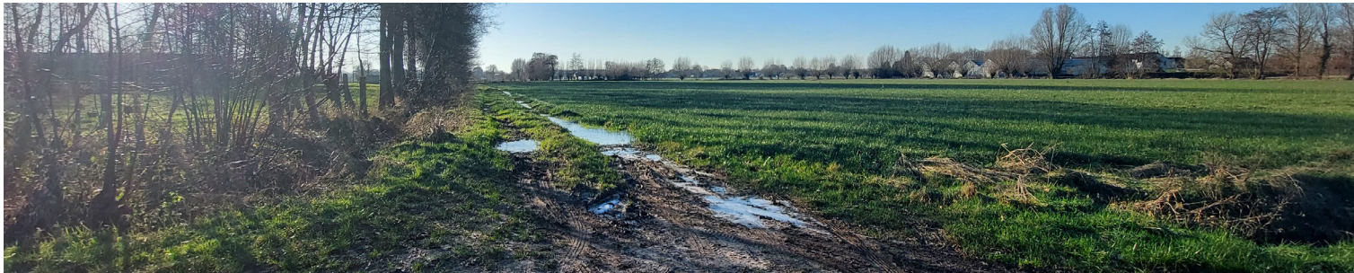
Sint-Martens-Latem ter hoogte van de Broekstraat, te verbeteren uitweg

Het deel Zuid 1 wordt als eerste uitgevoerd. Het is de zone ten zuiden van de E17 en ten oosten van de N60, op het grondgebied van Gent, De Pinte en Nazareth.