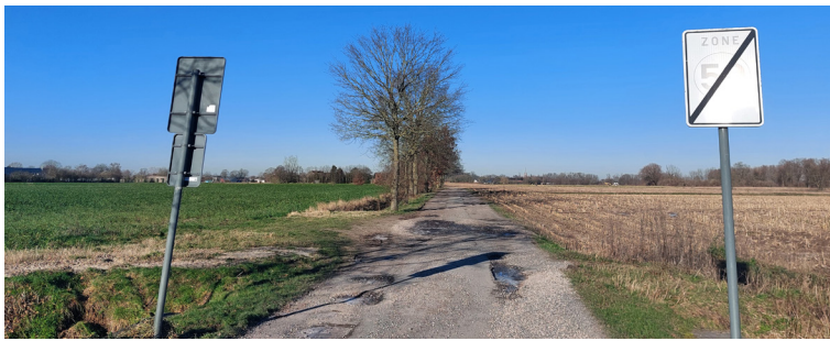
Nazareth ter hoogte van de Pontstraat