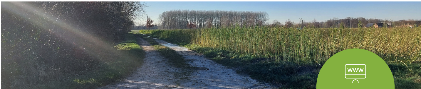
Deinze insteekweg ter hoogte van de Pontstraat