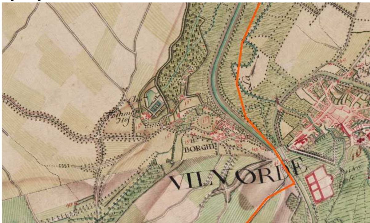
Afbeelding 7, Te Tommenhof en de Seneca Burcht op de kabinetskaart van Ferraris (1777).