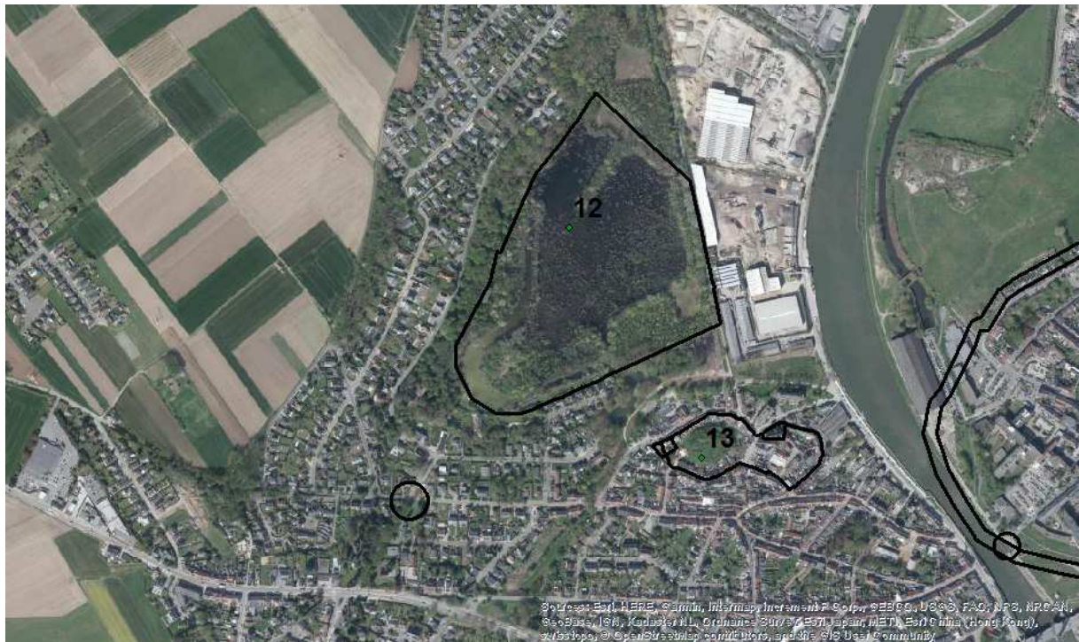
Afbeelding 6, orthofoto uit 2018 van de Seneca burcht (onder) en Ter Tommenhof (boven) met CAI begrenzing

westen van de burcht, gelegen aan de voet van de Borgtberg lag een laat middeleeuwse watermolen (Klein Molenveld).