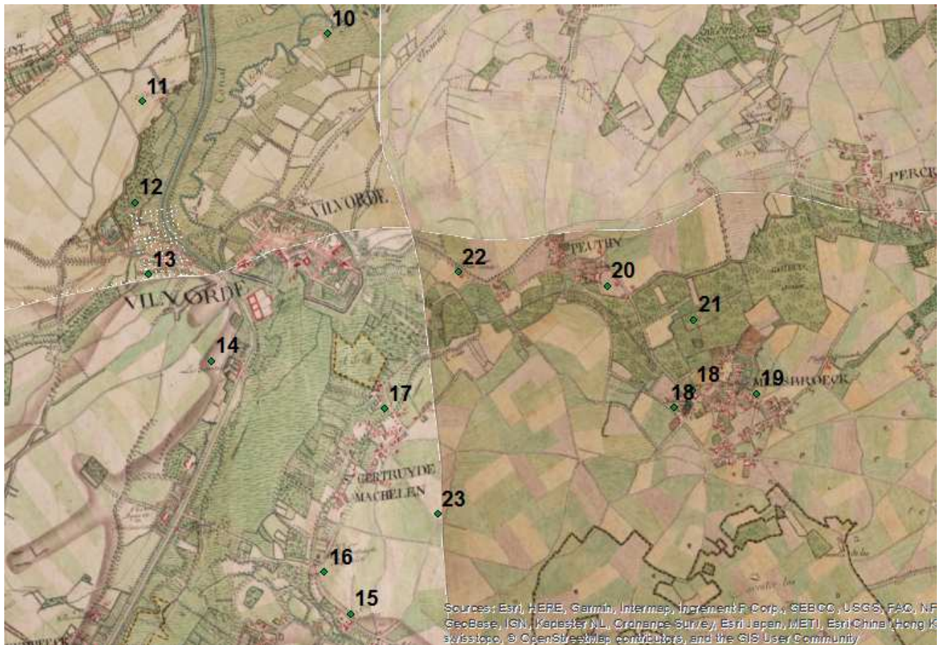
Afbeelding 5, Het projectgebied op de kabinetskaart van Ferraris (1777) met vindplaatsen uit de Late Middeleeuwen en Nieuwe Tijd: 10 motte Notelarenberg; 11 kasteel van Schiplaken; 12 ter Tommen Hof; 13 Seneca berg; 14 Drie Fonteinen; 15 Diegem Vermeeren; 16 kasteel Beaulieu; 17 kasteel Pellenberg; 18 kasteel Meerbeek/ Groot Hof van Melsbroek; 19 kasteel Boetvoort; 20 De Batenborghoeve; 21 Floordambos; 22 OLVkapel Steenvoorde; 23 19 de eeuwse steenwinning