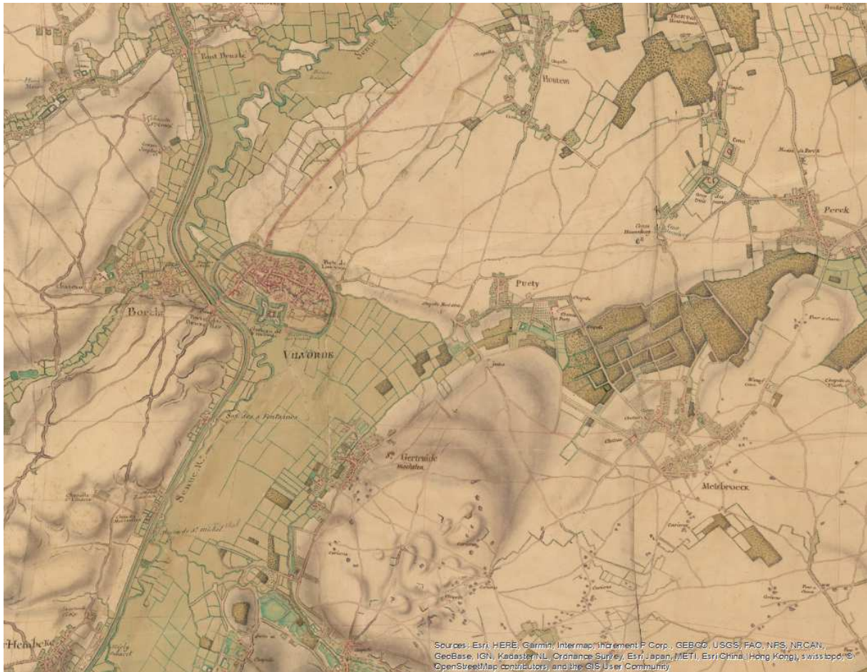
Afbeelding 1, het landinrichtingsgebied op de Villaret kaart (1745-1748)