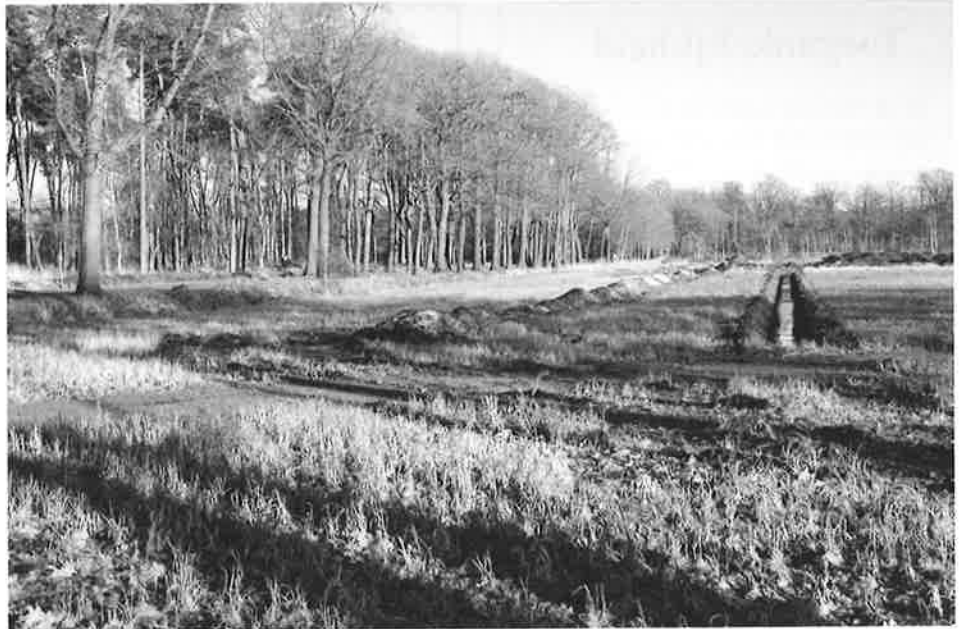
Foto 3: De Torendreef is een enkele dreef met een rij bomen aan elke zijde. Op 22 meter van de as van de weg wordt er een gracht gegraven, die de perceelsgrens van de landbouwgrond aangeeft. De strook tussen de bomen en het landbouwperceel wordt schrale grasvegetatie met bloemen.

Filip: Daarvoor heeft men zich bij het inrichtingsplan gebaseerd op het plan van Vandermaelen, waar die natuurstroken in voorkwamen. Het