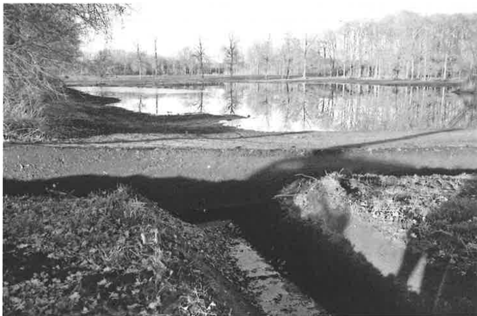
Foto 4: Het Langven is ontstaan op de natte gronden tegenover Bootjesven. Leem in de grond zorgt voor een soort kuip in de bodem waar het water blijft in staan. Jaren heeft men getracht om de grond op het water te winnen, maar het is nooit echt gelukt. Nu is het terug een ven. Foto 5: De Staakhevelse loop zal voor de afvoer van het regenwater van een groot deel van de landbouwgronden zorgen. Bij het nieuwe Langven wordt de Staakhevelse loop verlegd.

Het is een kwestie van samenwerken met alle partners die elk hun verantwoordelijkheid moeten nemen en hun werk doen. (fh)