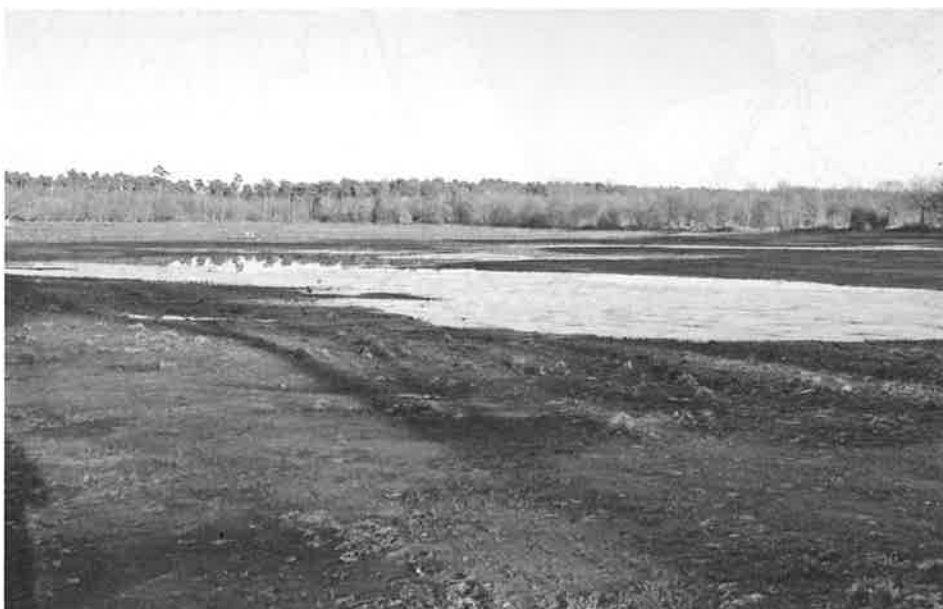
Foto 1 (links): Rond Bootjesven is een zone van 80 ha natuurgebied. Daar ontstaan tussen de heide nieuwe vennen, zoals hier het Hermansmoer. Foto 2 (rechts) Men herstelde een oude stuwconstructie om het water van het Hermansmoer te regelen.

Filip: Ja, bij het opmaken van het beheersplan is hier een zone voor heideherstel voorzien. Voorbij Bootjesven ontstond zo een tweede ven, het zogenaamde " Hermansmoer " ( foto 1 ). Zo waren er vanouds veel, zoals je kan zien op de Ferrariskaart van 1777. We herstelden ook een stuwconstructie onder de dreef ( foto 2 ), waarmee men het waterpeil van het ven kon regelen. Onze natuurwachter zal het gebruiken om te beletten dat er te veel water en dus ook vis in het ven komt. De streek rond Bootjesven is erkend als habitatgebied voor zeldzame planten en dieren zoals hier de kamsalamander, die niet overleven als er vis zit.