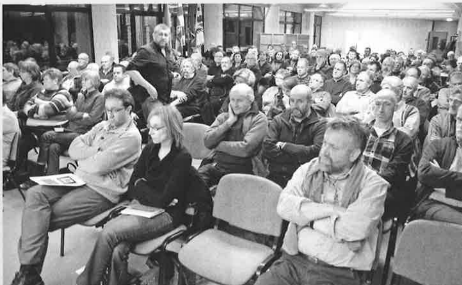
Er was enorm veel belangstelling voor de informatie over het beheer van de bossen en de dreven in de kolonie. Voor pakweg 30 % van de aanwezigen verdween, samen met de landlopers, "hun" kolonie en een stuk van hun jeugd.

Die dreven zijn aangelegd vanaf 1870 en de bomen kunnen meer dan 250 jaar oud worden. Ze zullen ook nooit boom per boom, maar in groep vervangen worden. Om de dreven meer vorm te geven en herkenbaar te maken, wordt er naast de bomenrij een zone van het bos gekapt, zoals aangegeven op de tekening op blz. 13. (fh)